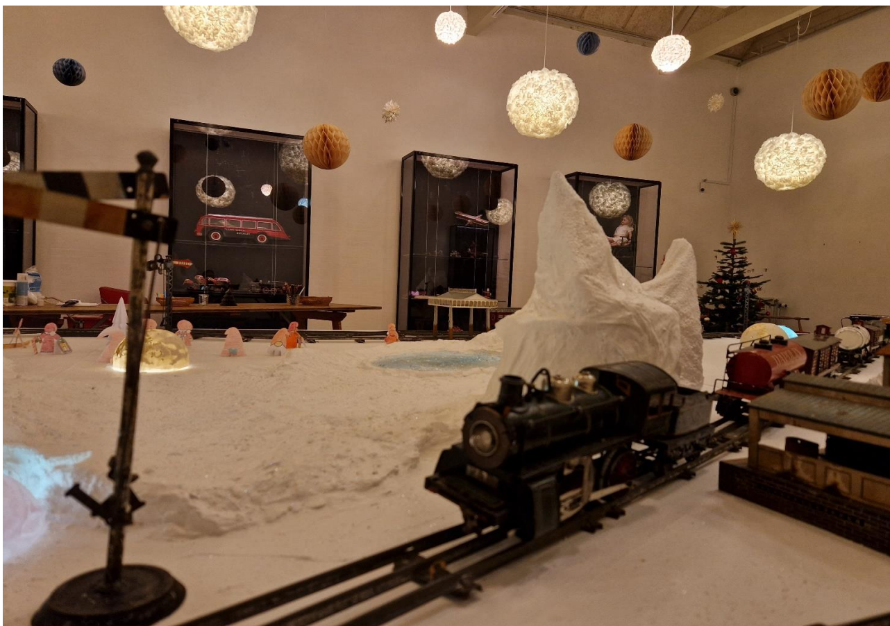
Den gamle togbane kom igen til ære og værdighed i det magiske vinterlandskab, omgivet af meget gamle julegaver.

Bag kulisserne blev der året igennem arbejdet på en ny montre til Tollundmanden. I november måtte han forlade sin gamle montre, der havde set bedre dage, og som lod en del tilbage at ønske, hvad angår klimasikring, og sikkerhed. Den nye montre er nu på plads og man kan nu igen se Tollundmanden, som vi kender ham men i lidt andre omgivelser.