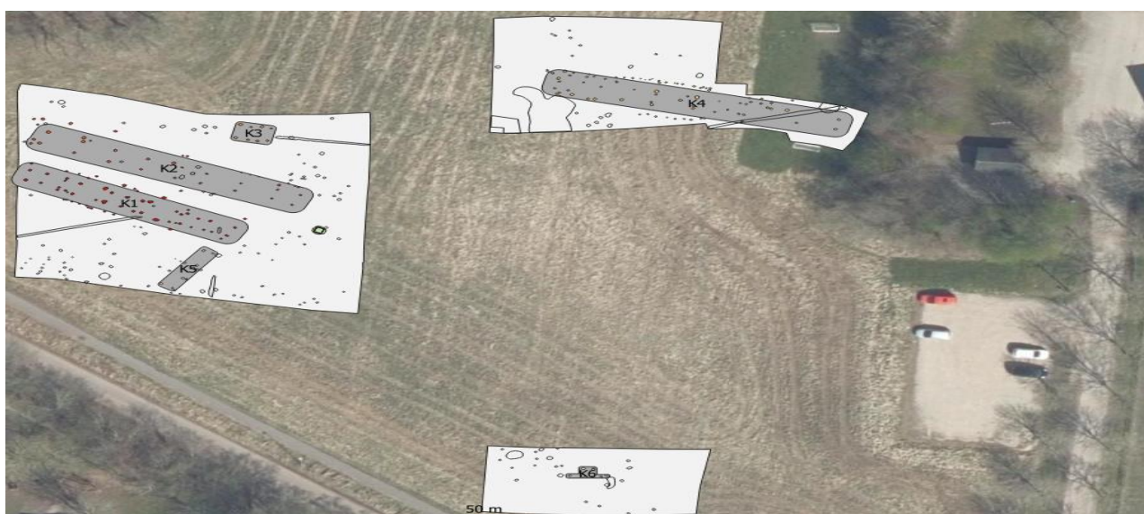
Jernalderhuse ved Harsnablundvej.