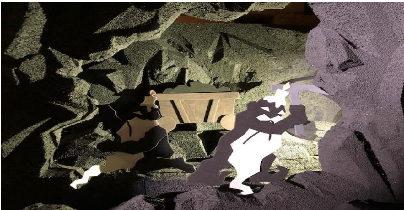
Dværgene knokler i minen, blot for at se deres ædelsten blive stjålet af de besøgende. Disse kan så ofre dem til en af de nordiske guder i håb om at blive stærkere, mere modig, frugtbar, eller måske god til at lyve.

10. november kunne vi åbne en finurlig dobbeltudstilling af den tjekkiske øjenlæge og kunstner Stanislava Stuchlá i den store sal. Det kom i stand gennem kontakterne i Festival of Wonder – Silkeborgs internationale dukketeaterfestival. Udstillingen bestod dels af en række sælsomme skabninger sammensat af knogler fundet i de bøhmiske skove og vejgrøfter. Anden del af udstillingen gengav i miniformat det cirkustelt – obludarium – som man kunne opleve på Havnepladsen under festivalen. De fleste figurer og dukker begyndte at bevæge sig i besynderlige bevægelsesmønstre, når man nærmede sig dem.