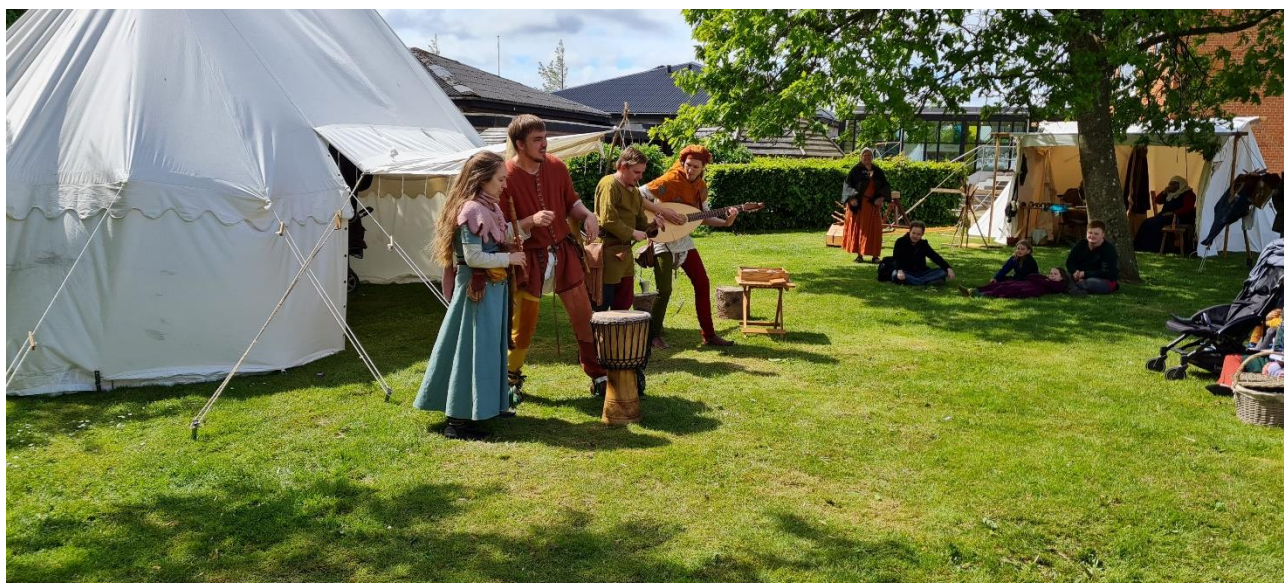
Der var musik og stemning på årets middelaldermarked på Blichereggen.

På Blichereggen blev det igen muligt at afholde et middelaldermarked i maj, og det endte som en gedigen succes med omkring 700 gæster i løbet af de to dage. På Hovedgården blev jernaldermarkedet også en succes, med rekordmange gæster og endelig var det en lettelse at Papirmuseet kunne afholde et velbesøgt kunsthåndværkermarked uden at skulle kontrollere Coronapas.