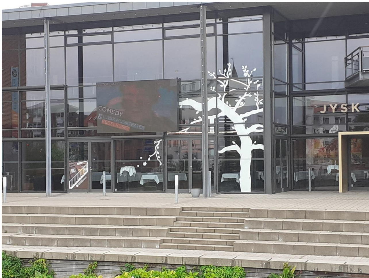
Papirmuseet lavede venuedressing til EuroMeet 2022. Træet er en gæstebog, the tree of outdoor greetings.

Silkeborg Kommune var vært for EuroMeet 2022, en europæisk outdoor konference. Eventet havde base i Jysk Musikteater, og Papirmuseet bidrog med venuedressing, workshops og aktiviteter. Det var en spændende opgave, som gav Papirmuseet masser af synlighed, og er et eksempel på, hvordan museet understøtter kommunens outdoorsatsning.