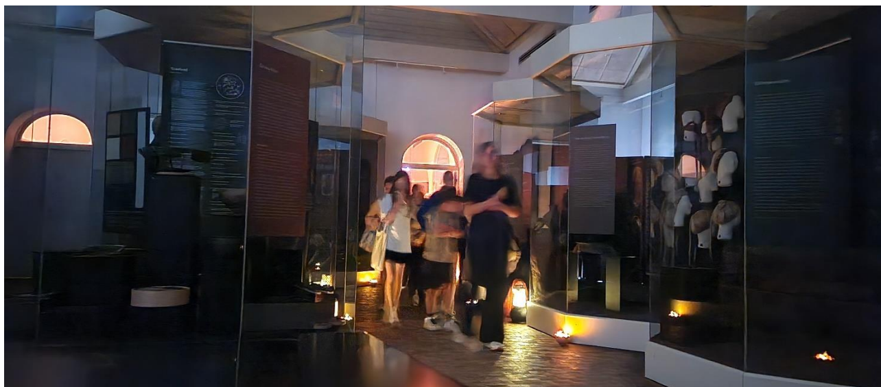
Ca. 1600 børn var på Kulturwalk til Tollundmanden under Regattaen.

På Blichereggen blev det igen muligt at afholde et middelaldermarked i maj, og det endte som en gedigen succes med omkring 700 gæster i løbet af de to dage. På Hovedgården blev jernaldermarkedet også en succes, med rekordmange gæster og endelig var det en lettelse at Papirmuseet kunne afholde et velbesøgt kunsthåndværkermarked uden at skulle kontrollere Coronapas.