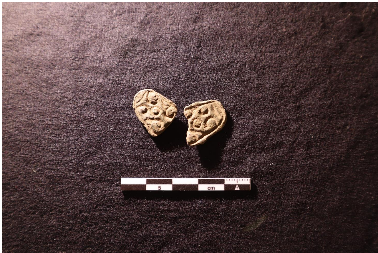
2022 bød også på en del metaldetektorfund. Her er det to stykker af et trekløvet spænde fra vikingetiden.

På et nyt erhvervsareal i Hårup havde en forundersøgelse afdækket henholdsvis et areal med bopladsspor fra slutningen af bondestenalderen/begyndelsen af bronzealderen og en overpløjet gravhøj. Gravhøjen var velbevaret og indeholdt en grav fra den yngre del af enkeltgravskulturen (2500-2300 f.v.t.), samt mindst fem andre grave. I syd blev der registreret spor efter huse fra overgangen mellem stenalder og bronzealder. På et mindre areal ved Eriksborg havde en forundersøgelse i begyndelsen af 2021 afdækket dele af en jernalderbebyggelse. Området blev i første omgang udlagt til grønt område, så fortidsmindet kunne bevares. Bygherre fik i 2022 behov for at bruge arealet til anlæggelse af et regnvandsbassin, og museet udgravede derfor et 2300 m 2 stort areal. Herved blev der fundet huse og andre anlæg fra yngre romersk jernalder/ældre germansk jernalder (200-600 e.v.t.). Yderligere forundersøgelser er foretaget Ved Sejlgård i Funder, Bakkeborg og Eriksborg i Gødvad.