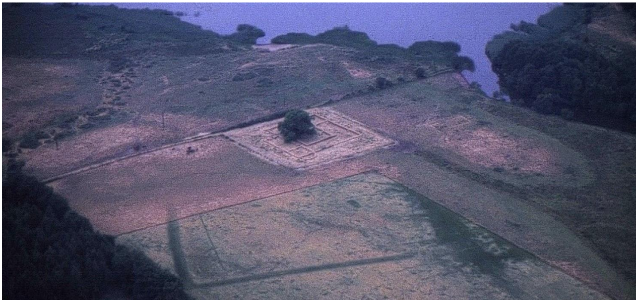
Et luftfoto fra 1992 viser en vinkelformet grav, der ligger skævt i forhold til klosteret. En formodning om at den hørte til et andet anlæg blev afkræftet ved udgravningen. Den afgrænser formentlig klostrets ydre gård.