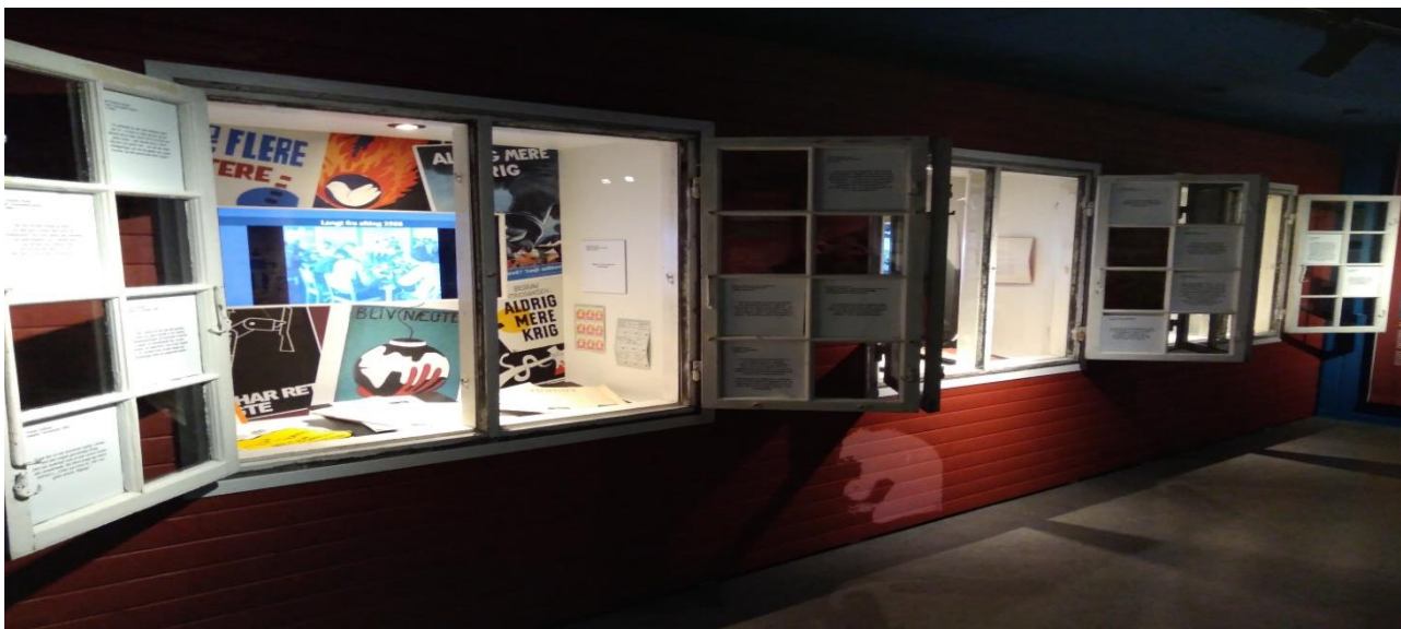
Sommerudstillingen på Blichereggen gav et kig ind gennem vinduerne på militærnægterlejren i Kompedal.