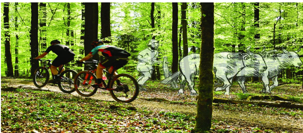
Outdoorudstillingen sigter imod at give publikum en fornemmelse af tidsmæssig dybde. I dag ligger der et MBT spor, men for 2.500 år siden lå her jernaldermarker.

På Hovedgården har vi kunnet åbne hele tre udstillinger i 2021. En særudstilling og to nye permanente udstillinger. Årets særudstilling: Silkeborg Outdoor - fra overlevelse til oplevelse griber fat i Silkeborgs nye