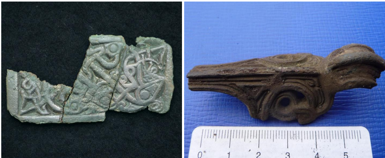
Pladefibula med dyreornamentik, Germansk jernalder, Relieffibula, germansk jernalder, Voel sogn. Tvilum sogn.

Detektorbrugerne har øjnene med sig, når de alligevel går og afsøger jorden for metaller, så ud over detektorfundene indleverer de også potteskår, slagge og flintredskaber. De er på den måde med til at give et meget mere nuanceret billede af fortidig aktivitet i kommunen, da de oftest går på andre arealer end arkæologerne, der jo primært styres af byggeaktiviteten.