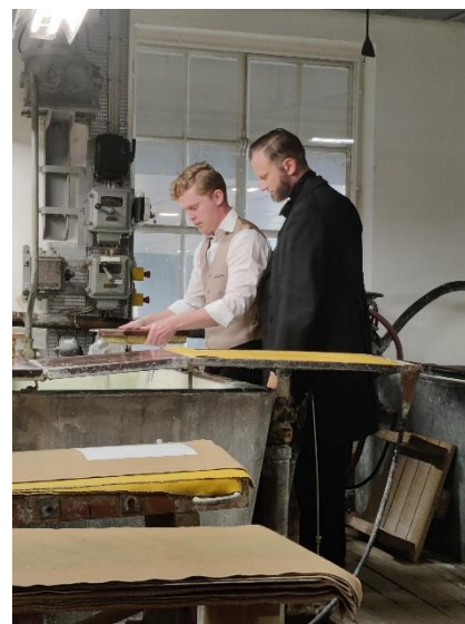
Skuespillerne, der spillede hhv. Michael og Christian Drewsen i musicalen Drewsen, laver papir.