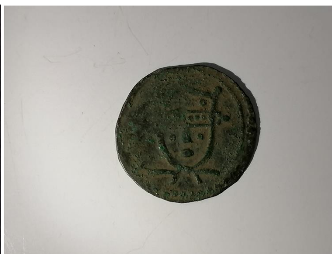
Mønt, Valdemar Sejr, Middelalder, Them sogn.