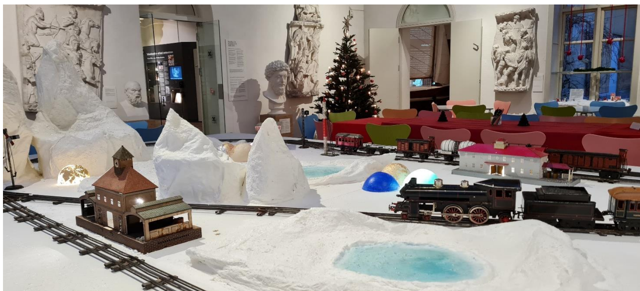
Julen på Hovedgården bød på juletræer, nisseagenter og et polarlandskab med togbanen fra Jessens Magasin.