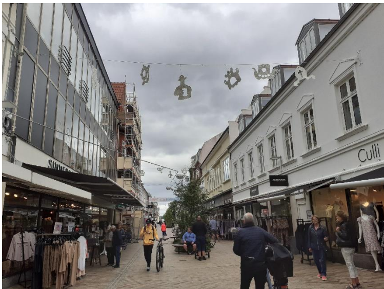
Papirikoner, lavet på papirmuseet, prydede den nyåbnede Vestergade.