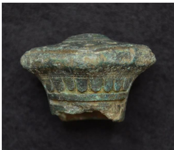
Sværdfæste knap, bronzealder, Linå sogn.

Der kommer i disse år så mange detektorfund ind, at det er svært at følge med. Der er således også kommet mange fine fund ind i løbet af 2021. Herunder vises nogle af de bedste fund.