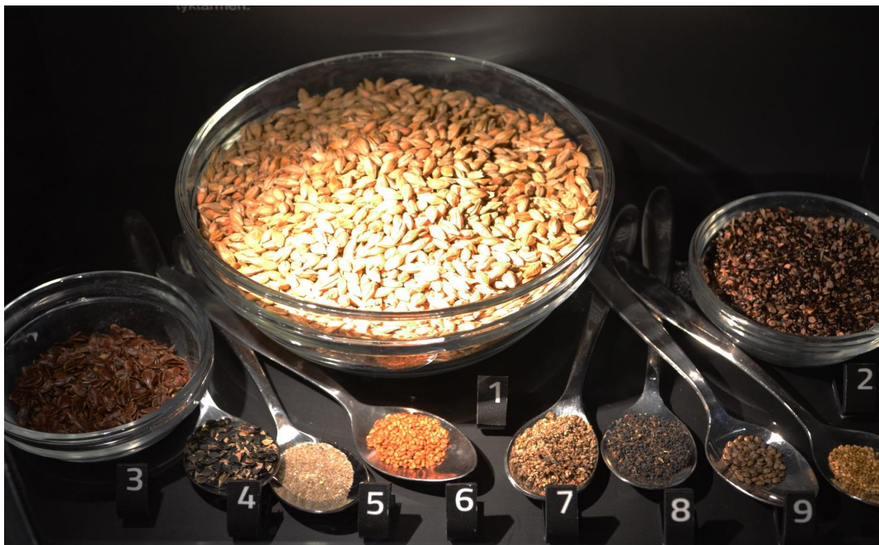
Tollundmandens sidste måltid bestod af 85% byg, 9% bleg pileurt og 5%hørfrø. Den sidste procent udgjordes af frø af ca. 20 forskellige urter og sand. Dertil spiste han fisk, ved vi nu.