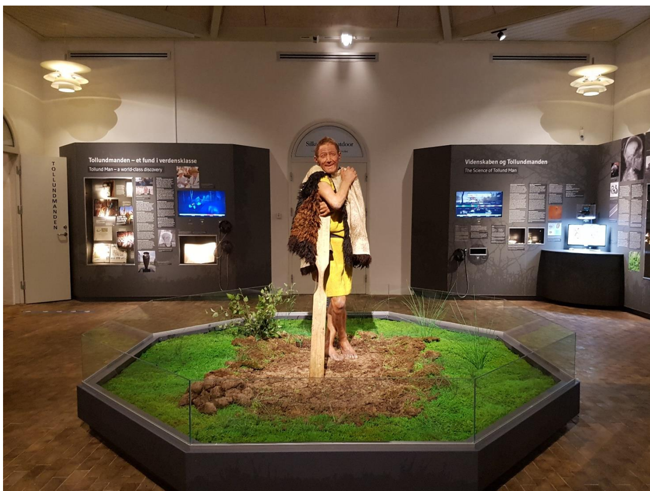
Tollund Man is in the building. Endelig, først i juni, ankom rekonstruktionen af Tollundmanden og udstillingen kunne åbnes med brask og bram, ad to omgange.

Vi kunne langt om længe åbne den nye permanente udstilling om Tollundmanden. Den skulle oprindeligt have været åbnet i 2020 – 70-året for fundet, men hele corona-situationen gjorde det umuligt. I april stod det meste klart, men udstillingens midtpunkt manglede. Genåbningen af museet i april blev derfor i stedet markeret ved at udgive Lars Lilholts sang, "Sig os nu hvad du hed" med tilhørende video. I begyndelsen af juni ankom udstillingens store midtpunkt: Rekonstruktionen af Tollundmanden i fuld størrelse, som han må have set ud kort før sin død for 2400 år siden. Den 20. juni kunne vi så endelig lave en officiel åbning for de mange sponsorer. Det foregik i et stort telt i haven, med plads til op til 100 gæster. Lars Lilholt åbnede