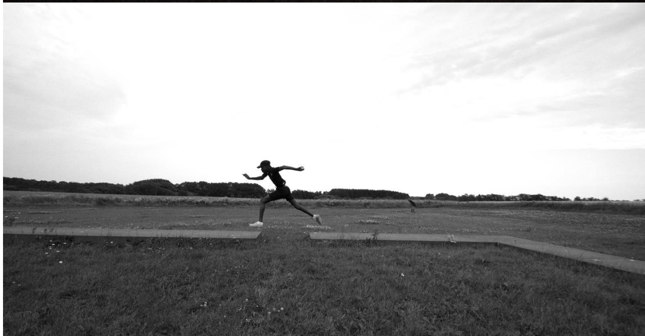
En af de 5.746 besøgende på Grathe Monumentet.